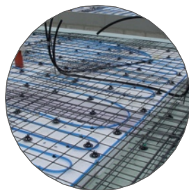
Fussbodenheizung, Elektro etc einlegen