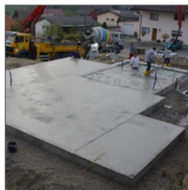
Betonieren und glätten