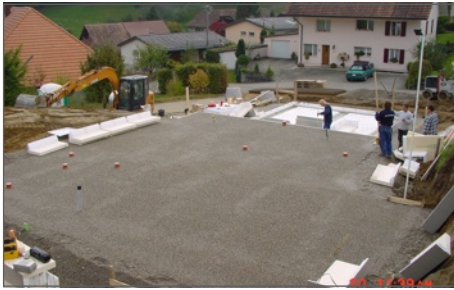
Splitt abziehen und Eckelemente ausrichten